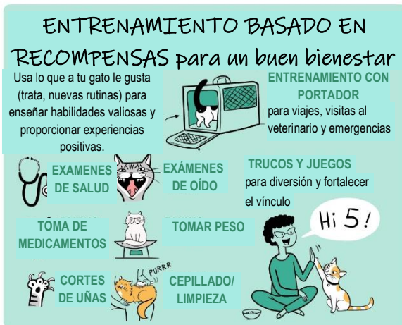
ILLUSTRATION: Lili Chin doggiedrawings.net/freeposters

REFERENCES: "PURR: The Science of Making Your Cat Happy" by Zazie Todd (2022)